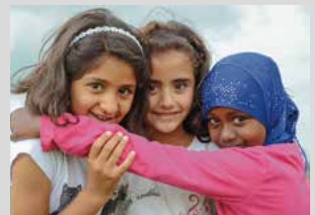
Der Förderverein unterstützt auch Gruppentherapien.