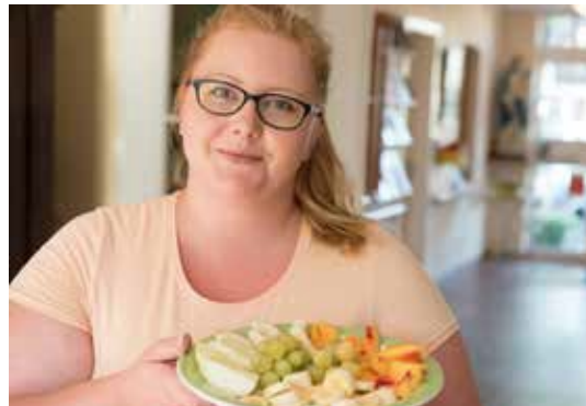
Hier noch eine Bilduntershcritg bxdrcrar fcrecsexf