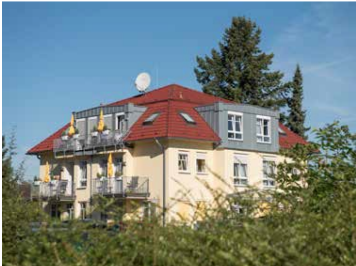
Hier noch eine Bildunterschrift bxdrcar forecsexf

Die stationären Hospize im Caritasverband für die Stadt Köln e.V. bilden gemeinsam mit den Einrichtungen der stationären Altenhilfe und stationären Behindertenhilfe das Geschäftsfeld Alter und Pflege. Durch gemeinsame Merkmale wie gesetzliche Grundlagen (WTG, WVG, SGB XI), die Bindung des Dienstes an ein Gebäude und erforderliche Dienstleistungspartner profitieren die Hospize durch Effizienz und Wirtschaftlichkeit von der Einbindung in dieses Geschäftsfeld und können zugleich den