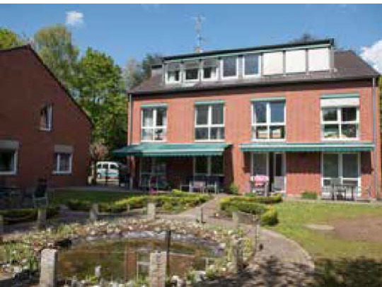
Hier noch eine Bildunterschrigt bxdrcrar fcrecsexf

Im Jahr 1990 wurde der Förderverein „Hospiz Köln-Porz e.V.“ gegründet, nachdem bereits zwei Jahre zuvor die Hospizidee in die Kirchengemeinde Porz-Urbach gebracht wurde. Bereits zu diesem Zeitpunkt verfolgte der Förderverein Hospiz Köln-Porz e.V. die Gründung eines stationären Hospizes. Nach mehrjähriger Vorbereitungszeit wurde die Idee zum Bau eines stationären Hospizes vorangetrieben. Die katholische Kirchengemeinde St. Bartholomäus stellte ein Grundstück zur Verfügung. In Kooperation des Förderverein Hospiz Köln-Porz und der Kirchengemeinde entstand das Hospiz an St. Bartholomäus, das im Jahr 2002 in Trägerschaft des Caritasverband der Stadt Köln e.V. seinen Betrieb aufnahm. Im Haus befinden sich der Förderverein Hospiz Köln-Porz e.V. mit seinem ambulanten Hospizdienst sowie das stationäre Caritas-Hospiz an St. Bartholomäus. Die Caritas-Hospize sind fester Be-