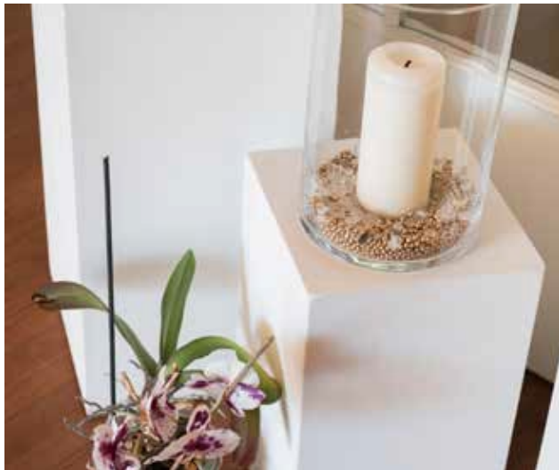
Hier noch eine Bildunterschrift bxdrcar frcexsf

Darum ist die Arbeit in den Caritas-Hospizen wichtiger und zentraler Teil der Angebote der stationären Pflege der Caritas in Köln.