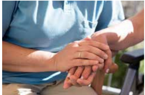
Hier noch eine Bildunterschrift bxdrcar forecsex

Ein Hospiz als Herberge für Menschen am Ende ihres Lebens soll Räume bieten, in denen man sich wohlfühlen kann, die mit dem medizinisch-pflegerischen Auftrag die räumlichen Rahmenbedingungen für eine gute Pflege bieten, zugleich aber wohnlich und häuslich und nicht funktional und institutionell wirken. Darum sind die Caritas-Hospize kleine und überschaubare Häuser mit hoher wohnlicher Gestaltung, die zugleich aber über alle technischen und funktionellen Einrichtungen und Ausstattungen verfügen, die für eine professionelle stationäre Pflege erforderlich sind. Pflege und psychosoziale Begleitung sind die Kernaufgaben des Hospizdienstes. Diese Aufgabenstellung ist aber nur möglich, wenn auch die hauswirtschaftlichen Erfordernisse professionell erfüllt werden. Mit Unterstützung externer Dienstleister für die Wäscheversorgung und