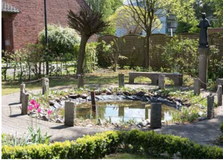
Hier noch eine Bildunterschrift bxdrcar forecsexf

So geschieht auch die Versorgung am Totenbett in Stille und Ruhe würdevoll. Der Verstorbene wird, wenn möglich mit Angehörigen, zurechtgemacht und nach Wunsch eingekleidet. Die Abholung des Verstorbenen aus dem Hospiz soll in Abstimmung mit den Angehörigen ausschließlich in einer würdevollen Form im Sarg erfolgen. Das Angebot einer gemeinsamen Abschiedsfeier im Zimmer des Verstorbenen ermöglicht es allen an der Begleitung beteiligten Personen, inne zu halten und Abschied zu nehmen. Angezündete Kerzen im Zimmer und Haus, Eintrag in Gedenkbüchern/auf